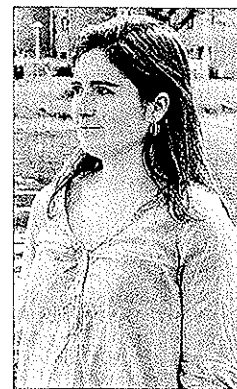
Imatge de la menorquina.